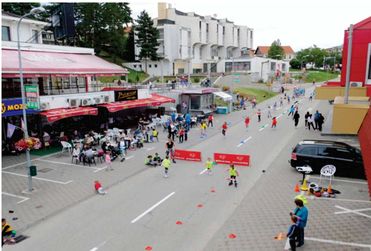
Слика 3.1. Пјешачка зона општине Мркоњић Град

Бициклически саобраћај, у постојећем стању, одвија се коловозом постојећих улица и није заступљен међу грађанима као један вид превозног средства или као рекреацијски саобраћај.