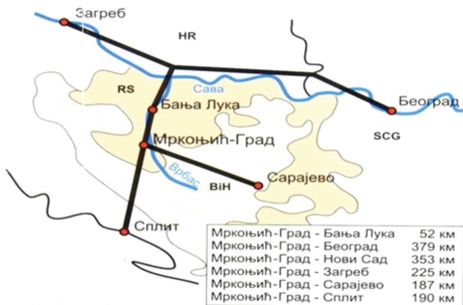
Слика 1. Графички приказ географско-саобраћајног положаја општине Мркоњић Град

Сврха израде овог стратешког документа, као и других сличних докумената је да Мркоњић Град у времену које долази постане центар новог, технолошки напредног и развијеног привредног и пословног дјеловања, развијен и јасно диференциран град у којем су достигнути модерни европски стандарди живљења.